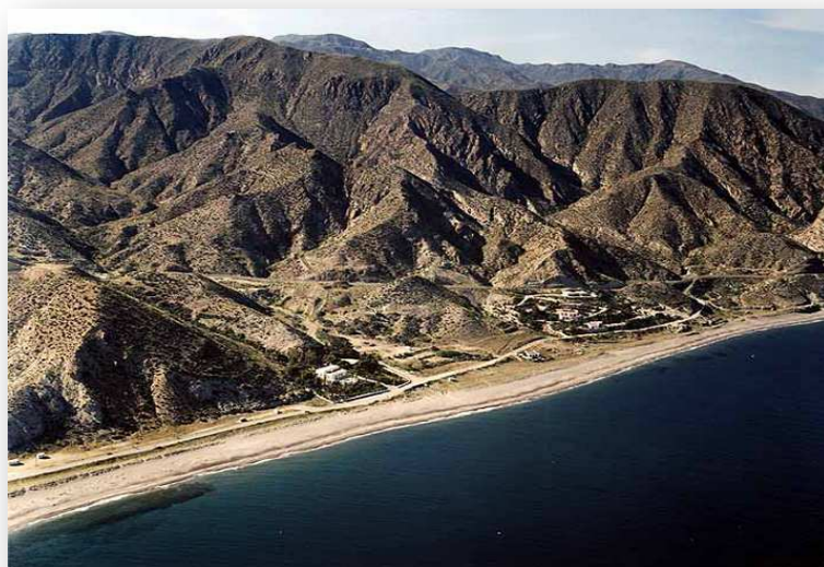
La playa del Algarrobico, parque natural Cabo de Gata, antes de la construcción del hotel.

Esperamos que esta obra ayude a que este Algarrobico y todos los “Algarrobicos” del mundo desaparezcan.