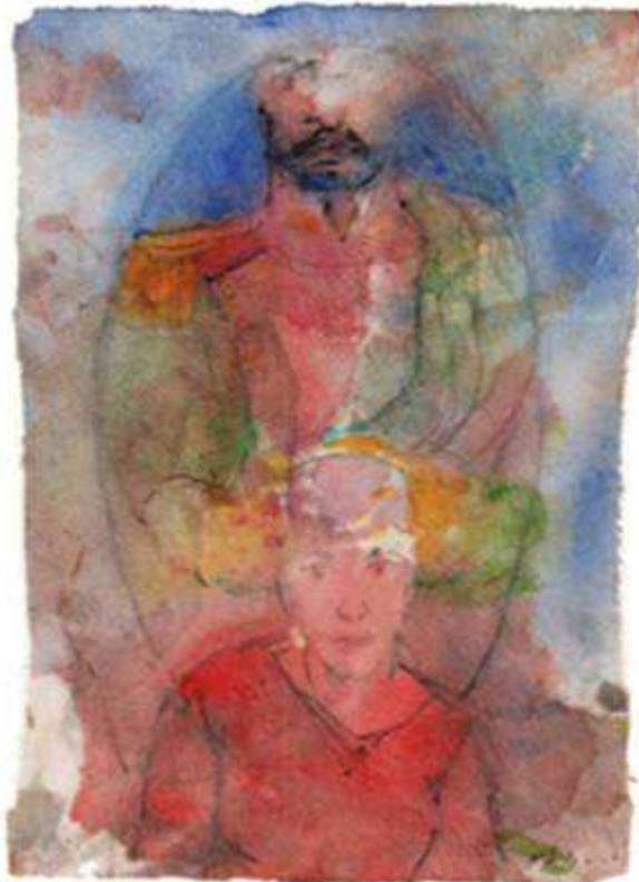
Una de las ilustraciones de Carlos Alonso

ESTA EDICIÓN ES REALIZADA POR DEL CENTRO EDITORES EN COLABORACIÓN CON LA FUNDACIÓN INTERNACIONAL JORGE LUIS BORGES , CONMEMORATIVA DEL BICENTENARIO DE LA REVOLUCIÓN DE MAYO, OCURRIDA EN BUENOS AIRES, EL 25 DE MAYO DE 1810, QUE SUPUSO LA INSTAURACIÓN DEL PRIMER GOBIERNO AUTÓNOMO EN EL RÍO DE LA PLATA.