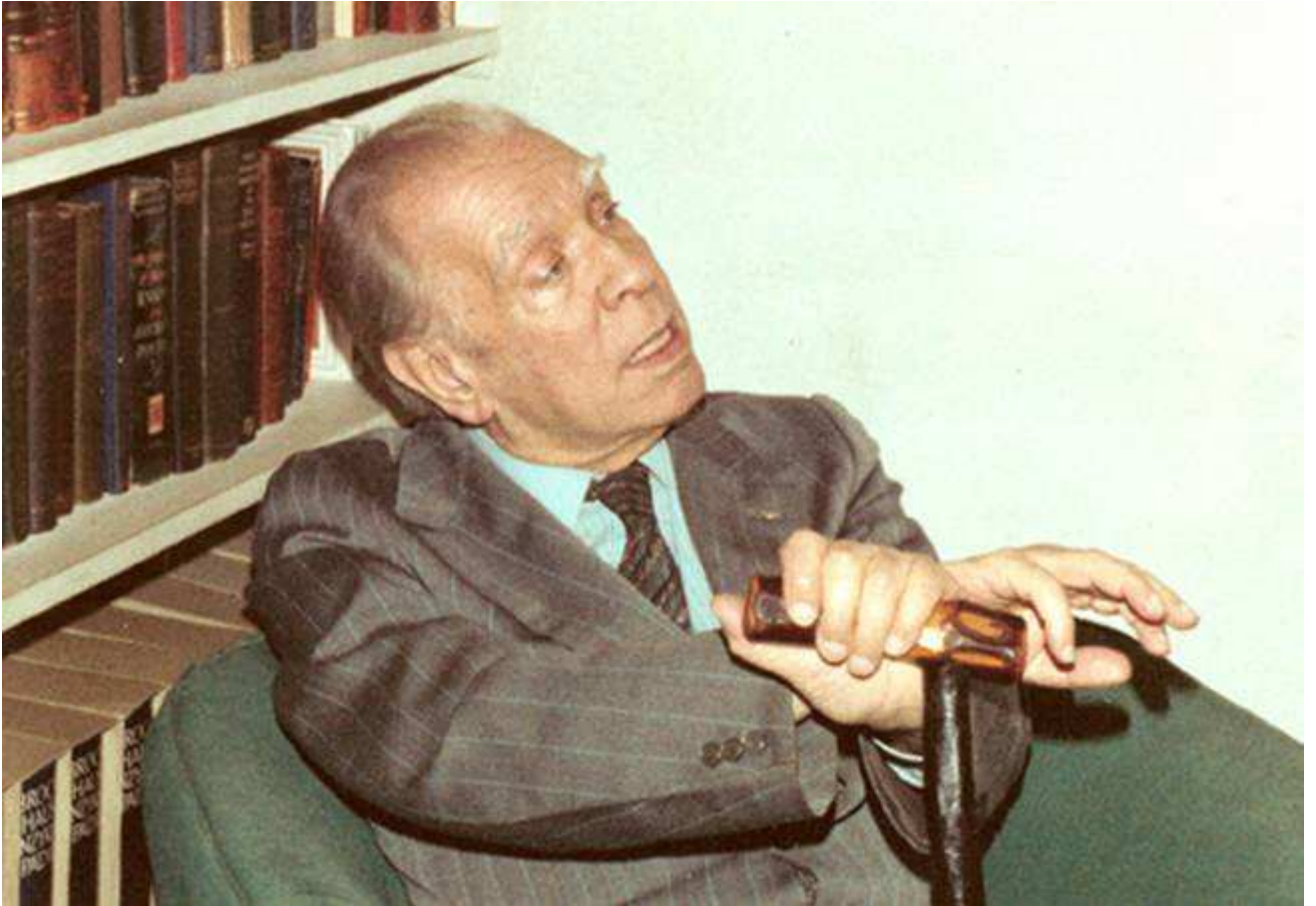
Borges en su casa de Buenos Aires, 1982