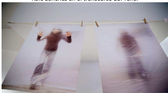
Trabajos del alumnado del taller de fotografía