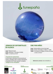
Alumnos y alumnas del C.P Luis de Santangel, El Saler (Valencia) . Funermostra 2015