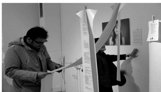
El público lee algunos trabajos del taller de escritura