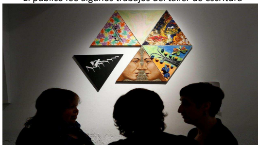
Cuadro colectivo de Flavia Totoro